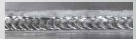
DUO Plus™ - Aluminium

Funktionen sikrer øget kontrol over smeltetbadet og reducerer varmetilførslen.