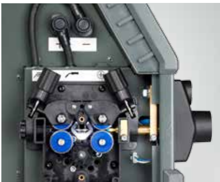
LED lys i trådkonsol (varenummer 78861545)